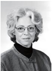
ビッキー・デ クラーク・ルビン バリデーション トレーニング 協会代表

認知症の高齢者のみならず、介護の専門職や介護を行う家族のためにも役立つ方法として世界で高く評価され、アメリカ合衆国、カナダ、ヨーロッパ、オーストラリアなどの 30,000 以上の高齢者施設で採用されてきました。