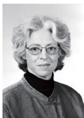
ビッキー・デ クラーク・ル ビン バリデーション トレーニング 協会代表

認知症の高齢者のみならず、介護の専門職や介護を行う家族のためにも役立つ方法として世界で高く評価され、アメリカ合衆国、カナダ、ヨーロッパ、オーストラリアなどの 30,000 以上の高齢者施設で採用されてきました。