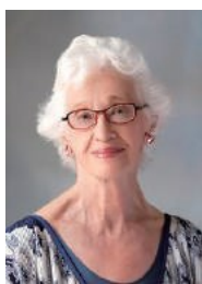
ナオミ・ファ イル バリデーション創始者

バリデーションとは、アルツハイマー型認知症および類似の認知症高齢者とコミュニケーションを行うための方法の一つです。